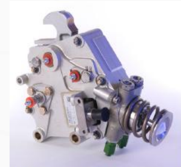
Boitiers accrochage A320